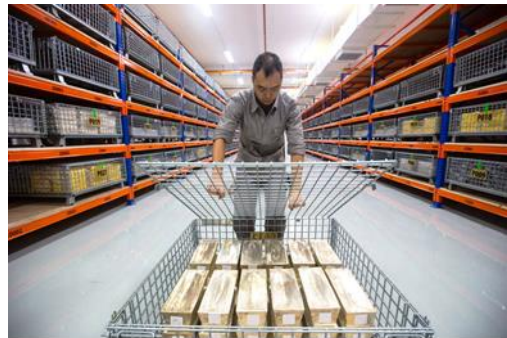
TSH의 케이지 안에 보관된 실버바 1,000온즈

모든 보관소의 규제는 싱가포르 규제에 따라 운영이 되며 고객 보고 요건이 없습니다.