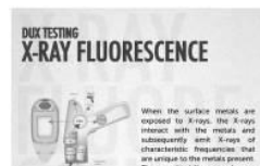
< X-Ray Test >