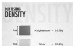
< Density Test >

모든 DUX 검사 결과는 검사결과를 기록하고 평가하는 '허용 오차 데이터베이스'에 업로드가 됩니다. 그런 다음, 테스트 결과를 온라인으로 검색할 수 있으며 보관금속(Parcel)에 연결하거나 보관소를 이용하지 않은 귀금속 검사의 경우 검사 샘플을 표시하기 위해 특수한 스티커를 사용하여 부착합니다.