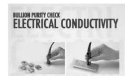
< ECM Test >